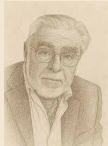
Etile ~ Lo Sperimentatore