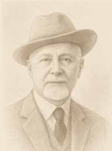
Etile ~ Il Comunicatore