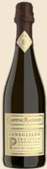
Real Casa Conegliano Prosecco Superiore D.O.C.G. - Brut

Autenticità storica, struttura, pura espressione del terroir.