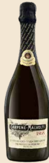
Lo Storico Conegliano Valdobbiadene Prosecco Superiore D.O.C.G. - Extra Dry

Autenticità storica, struttura, pura espressione del terroir.