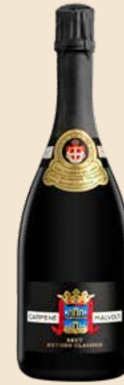
Tarvisium Metodo Classico - Brut

Il nostro classico. Eleganza, freschezza, identità del territorio.